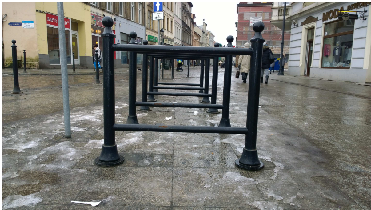
Przykładowy stojak ozdobny ustawiony na terenie m. Bydgoszczy.